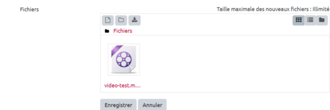
Tableau de bord ► Pages du site ► Fichiers personnels

Votre fichier est alors stocké dans votre réserve personnelle. Vous êtes le/la seul(e) à pouvoir accéder à ces fichiers. Pour les diffuser sur votre espace de cours, allez sur le cours concerné, puis