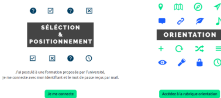
PRELUDE - La plateforme de pré-rentree Unicaen

En cliquant sur “Je me connecte” , l'utilisateur accède aux différents modes de connexion disponibles :