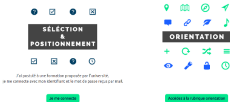
PRELUDE - La plateforme de pré-rentree Unicaen

En cliquant sur “Je me connecte” , l'utilisateur accède aux différents modes de connexion disponibles :