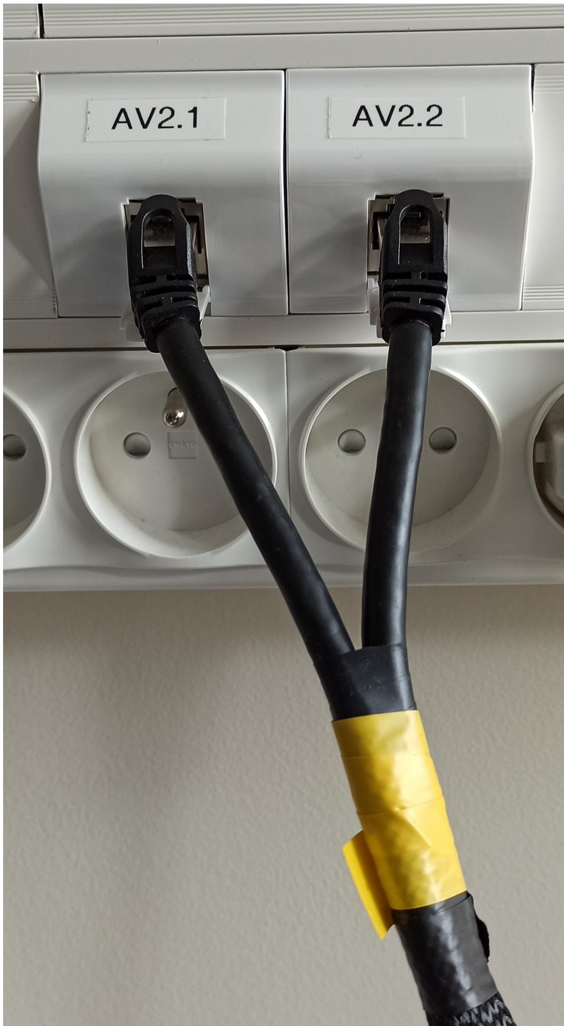
point de connexion mural